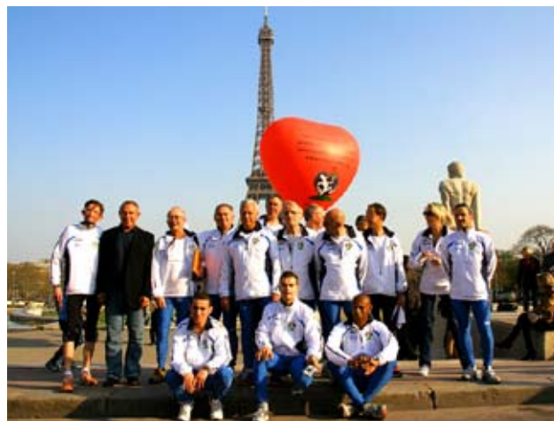
L'équipe des greffés au départ

DIMANCHE 31 MARS - EPILOGUE & ARRIVÉE AUX ARCS MOUTIERS ET BOURG SAINT MAURICE - Villes du cœur