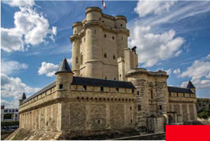
Le chateau de Vincennes