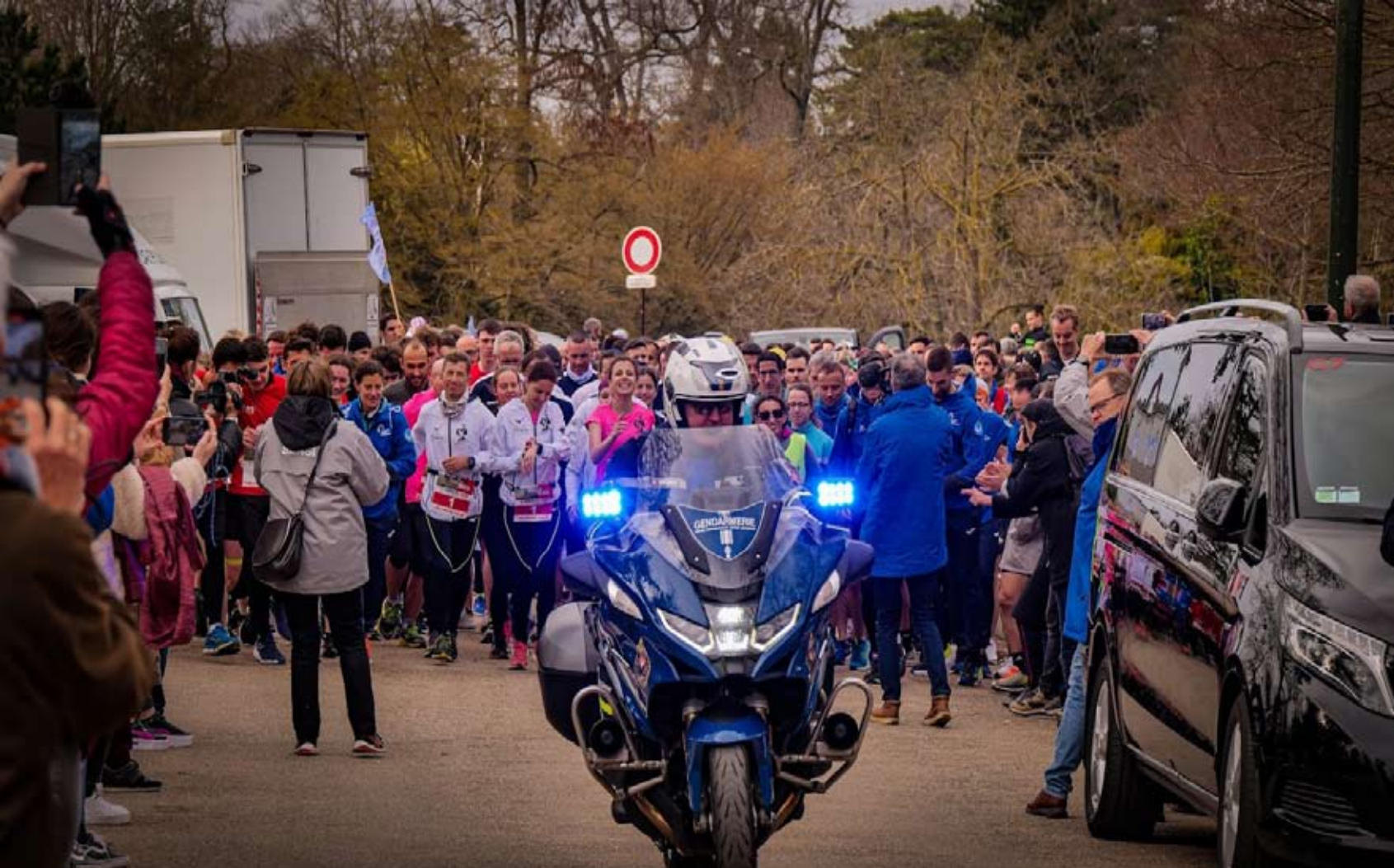
Départ CDC 2023

Course Du Coeur 2024 N°01 - Mercredi 20 mars