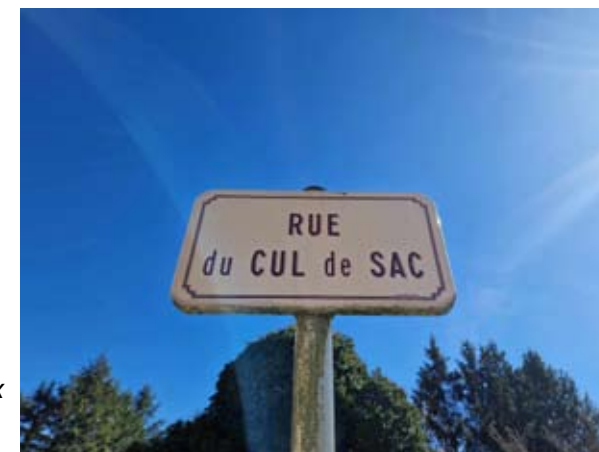
Arnay sous Viteaux

Inscription! Inscription! Inscription! Un cri presque primal lancé par l'homme à la casquette rouge... A peine arrivé, pensez à