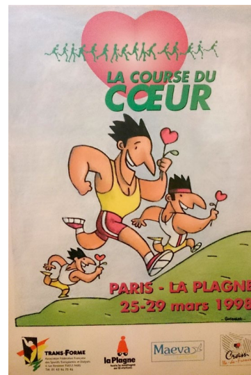
L'affiche de la Course 1998

Courue par équipes et par relais, bien médiatisée par nos journalistes et leurs amis, la Course du Coeur eut bien vite du succès , attirant de plus en plus d'équipes à laquelle vint se joindre, un peu plus tard, une équipe de greffés du foie, du coeur, du rein, ce qui donna tout son sens à l'épreuve.