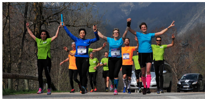
La dernière étape de la Course du Coeur vers les Arcs

Quatre « e-reporters » seront détachés par Oracle pendant la course. Ils seront identifiables par les sigles « # » et « @ » et couvriront l'événement en temps réel.