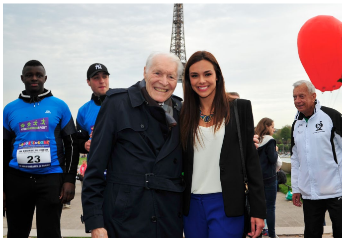
Le Pr Christian Cabrol et l'ex Miss France Marine Lorphelin sont les parrains de cette 30 e édition

Depuis de nombreuses années, la Course du Cœur reçoit le soutien de personnalités de tous les domaines. Souvent fidèles et très engagées pour la cause des dons d'organes, elles se retrouvent au départ à Paris pour encourager les coureurs greffés.