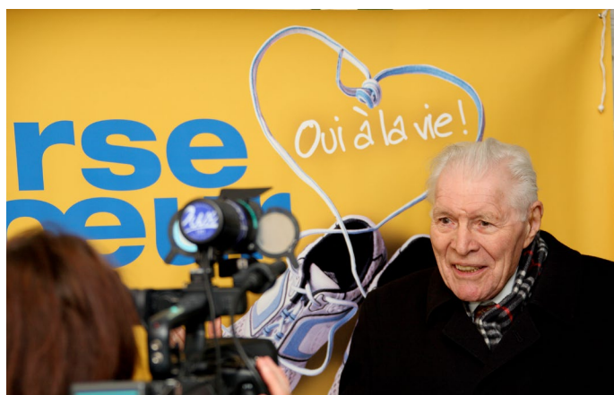
Le Pr Christian Cabrol soutient la Course du Coeur depuis sa création