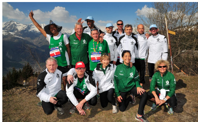
L'équipe Trans-Forme à l'arrivée de la Course du Cœur

Trans-Forme - agréée formation - mène des projets à l'attention des unités de greffe et de dialyse adultes et pédiatriques et promeut la pratique de l'activité physique comme outil de réhabilitation , publie de nombreuses brochures à l'attention des patients et du grand public, et organise des symposiums médicaux sur le thème de la qualité de vie retrouvée grâce à l'activité physique.