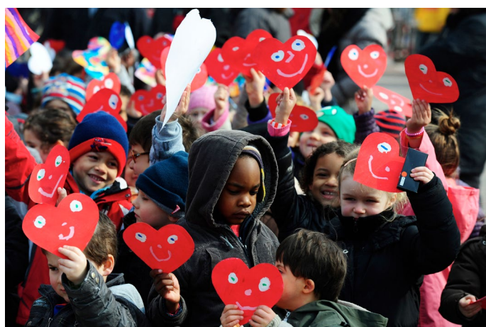
Les enfants sur le passage de la course

- La Compagnie Tutti Quanti , avec son spectacle «Un Don pour La Vie»