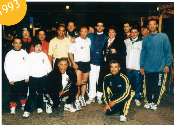
L'équipe des greffés