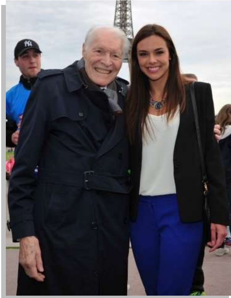
Photo : Pr Christian Cabrol et Mme Marine Lorphelin – Miss France 2013

sous le parrainage du Pr Christian Cabrol pionnier de la transplantation d'organes auteur de la 1 ère greffe du cœur en Europe (27 avril 1968)