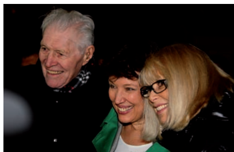
Mireille Darc, Roselyne Bachelot, le Pr Cabrol