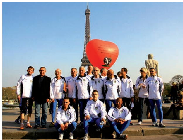
L'équipe des greffés au départ

Fondation GDF-SUEZ/Equipe du Cœur, GROUPE DASSAULT, HP, MGC CŒUR, NATIXIS, NOVARTIS PHARMA, RENAULT, ROCHE, RTE, SAP FRANCE, SAS FRANCE, SILCA, TOTAL, ORACLE ET SCC (@TripleCoeur), VM WARE