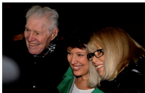
Mireille Darc, Roselyne Bachelot, le Pr Cabrol