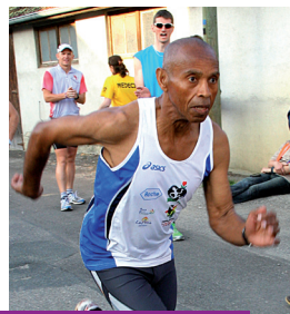
Affande 48 ans, greffé du foie